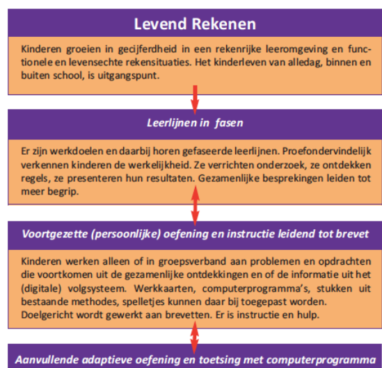
Figuur 1: Dat telt in kort bestek

De inhoud van het boek vormt ook de basis voor teambijeenkomsten over Levend Rekenen. In overleg stellen we een programma op waarbij wordt uitgezocht hoe het werken met Levend Rekenen naast de rekenmethode mogelijk is. Voor inoefenen van basisvaardigheden en het bewaken van de doorgaande lijnen kan extra aandacht worden besteed tijdens deze bijeenkomsten.