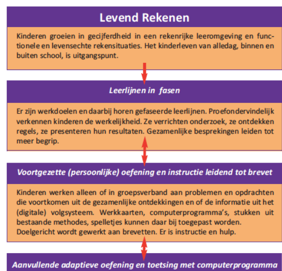
Figuur 1: Dat telt in kort bestek

De inhoud van het boek vormt ook de basis voor teambijeenkomsten over Levend Rekenen. In overleg stellen we een programma op waarbij wordt uitgezocht hoe het werken met Levend Rekenen naast de rekenmethode mogelijk is. Voor inoefenen van basisvaardigheden en het bewaken van de doorgaande lijnen kan extra aandacht worden besteed tijdens deze bijeenkomsten.