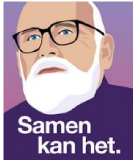
(verkiezingsposter 2023 GroenLinks PvdA)

Bij het werken met vrije teksten is er aan het eind een fase waarin de besproken en geredigeerde tekst wordt verspreid naar het 'grote publiek'. Altijd hebben we daarbij oog voor illustraties die de tekst ondersteunen. Tekst en beeld maken het verhaal samen sterk. Kijk naar de verkiezingsposters en je ziet hoe met zorg de woorden maar vooral ook de beelden zijn gekozen. Niet los van elkaar maar samen brengen ze de boodschap over het voetlicht. Zo is het, hoort het ook te zijn bij de teksten die we met onze groep publiceren. Moderne technieken helpen bij dit proces: opmaak van het beeld kan uitstekend met de computer. Kinderen moeten dat ook zeker leren en toepassen. Maar de grafische technieken zijn ook zeker de moeite waarde om te gebruiken in je klas.