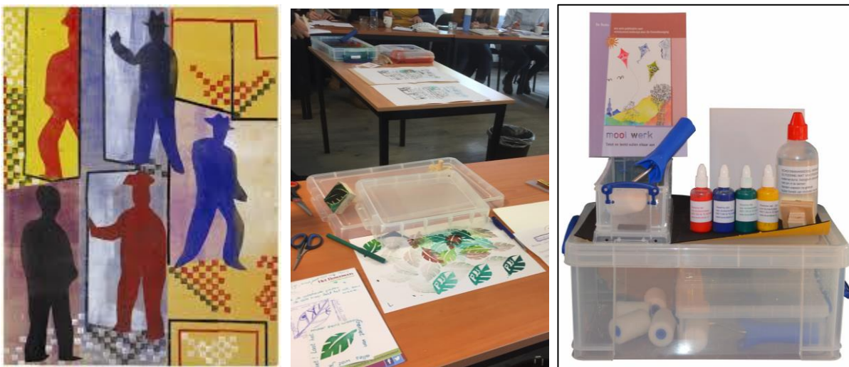
Illustratie Draaideur van het postkantoor H N Werkman

Werkman (1882-1945) kon het! Hij paste om zijn indrukwekkende prenten te maken de stempel- en sjabloneer techniek toe die inmiddels door kunstenaars is herontdekt en wordt gebruikt. Kijk op internet en vindt de prachtige voorbeelden. Maar leraren en kinderen kunnen het ook. En hoe! We zien de prachtig geïllustreerde teksten in de scholen die werken met de sjabloneerdoos. Inmiddels weten behalve scholen ook ouders ons te vinden: tijdens de vorige corona-golf werd er wat afgedrukt! De sjabloneerdozen worden geleverd samen met het boekje Mooi werk, waarin deze werkvorm naast andere illustratietechnieken staat beschreven.