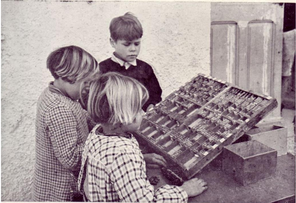
Kinderen zetten hun tekst. Freinet.

In De Moderne School schrijft hij dat het onjuist zou zijn onvermeld te laten wat pedagogen allemaal te danken hebben aan Decroly, aan mevrouw Montessori en aan de toegewijde leidsters die de Franse kleuterscholen zo'n goede naam hebben bezorgd. En in zijn publicatie over wat hij noemde pedagogische invarianten ( Les Invariants Pédagogique, Code pratique , in het Nederlands vertaald als Pedagogische kenmerken, een praktijkcode voor freinetwerkers , opgenomen in De Freinetwerker , deel 8 van De Reeks ) begint hij met een citaat van Montessori: