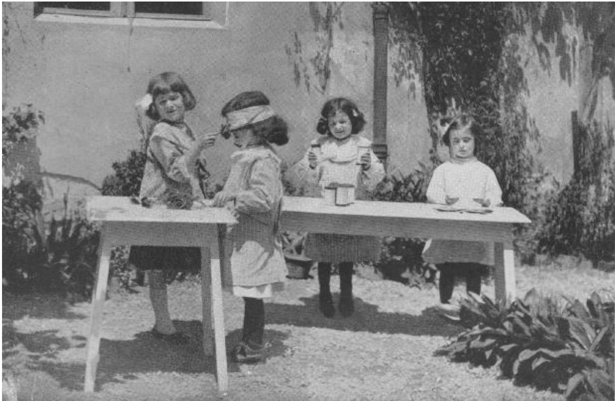
Drie vormen van zintuiglijke oefening: reuk, gehoor en gewichtszin. Montessori.

Maar, en Freinet houdt niet op dat te benadrukken, dat de geperfectioneerde methodes zo-als die van mevrouw Montessori, onvoldoende rekening houden de gevarieerde complexiteit van het kinderleven. In De Moderne School schrijft hij: