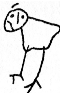
Figuur 33 Pierrot (5.00).